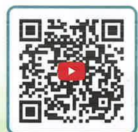
《捷徑是最遠的》 反毒繪本動畫