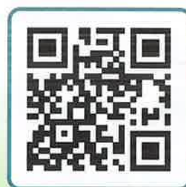
台灣無毒世界協會官網