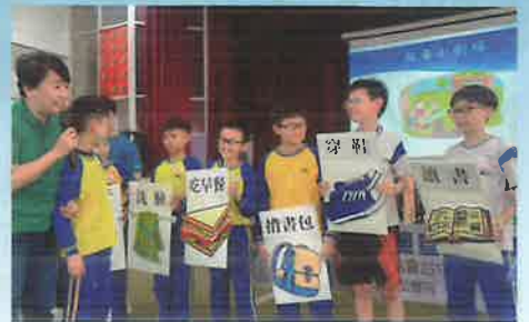
▲瞭解毒品的影響－趣味短劇