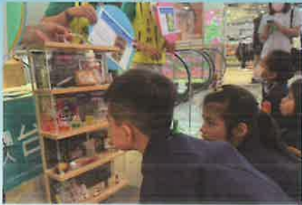
▲毒品變裝秀－辨識仿真毒品