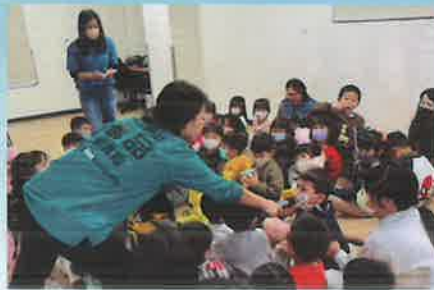
▲歡樂中學習－演講互動