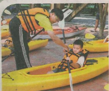
▲校長指導學生划船動作。

初學的學生因技巧不熟，常抓著船槳奮力前划，卻使獨木舟在原地打轉。這時，最溫暖的畫面，便是同儕彼此加油打氣，發揮團隊精神齊頭並進。六年甲班的母親說：「我要學會駕獨木舟，的終極目標！」