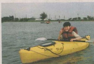
▲學會駕舟，自由航行。