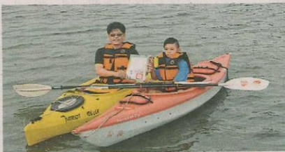
▲畢業生須划獨木舟向師長領取畢業證書。